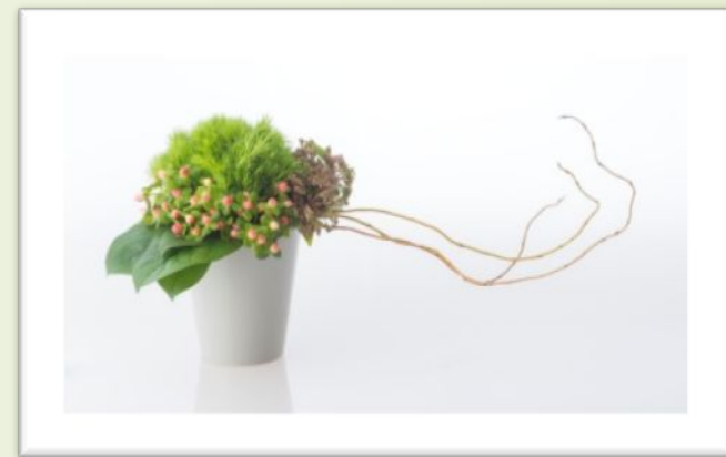
Basic Course No10 形和线构成