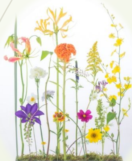
Basic Course No6 并行 装饰