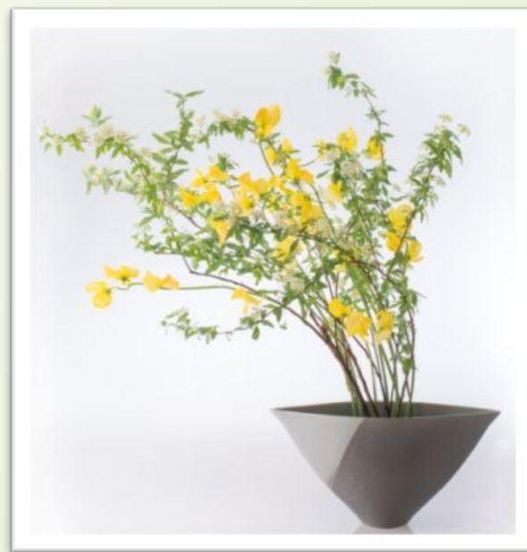
Basic Course No12 AFCA花道