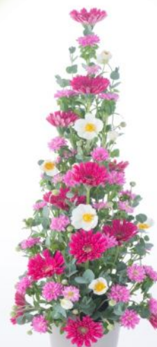
Regular Course NO15 垂直花艺